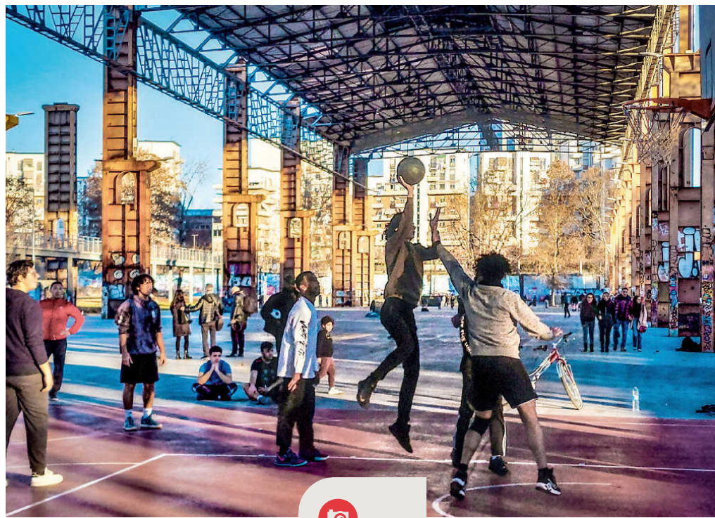
Lo scheletro delle vecchie acciaierie è il fulcro del nuovo Parco Dora sulla Spina 3