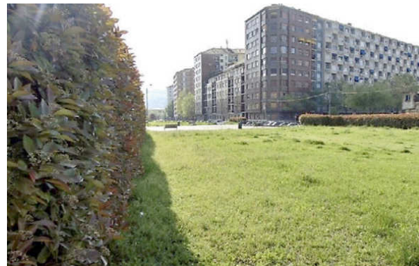
Alla Crocetta l'interramento della ferrovia ha fatto nascere il nuovo parco della Clessidra