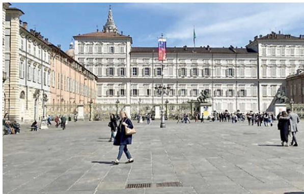
Uno scatto di piazza Castello negli anni 80 e come si presenta dopo la pedonalizzazione