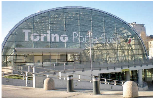
La stazione ferroviaria di Porta Susa negli anni 60 e oggi dopo la trasformazione